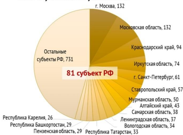
Число обученных по субъектам РФ