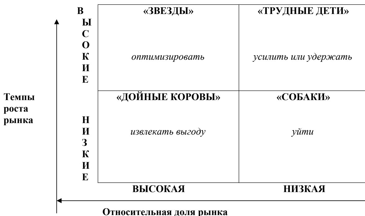
Рис. 1. Матрица БКГ «Рост-доля рынка»

Рынок клининговых услуг в целом можно отнести к быстрорастущим, однако на различных потребительских и продуктовых сегментах ситуация значительно отличается.