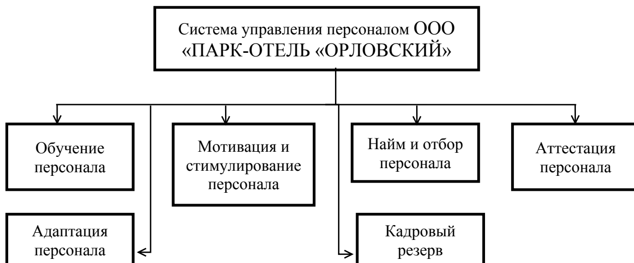
Рисунок 1 - Система управления персоналом ООО «ПАРК-ОТЕЛЬ «ОРЛОВСКИЙ»