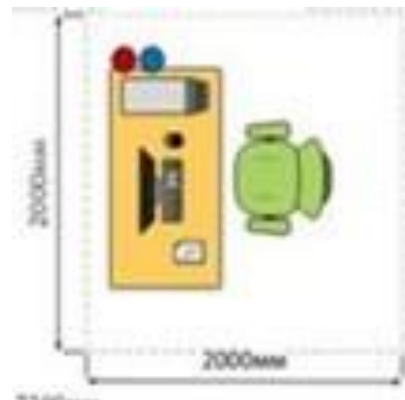
Зона площадки Б

Рабочее место участника (2X2 м) в составе: стол; стул; компьютер; монитор; клавиатура; мышь; USD- накопитель; набор ПО