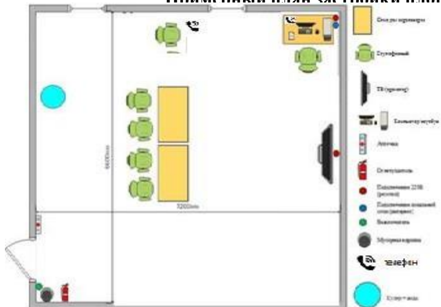
Зона площадки А