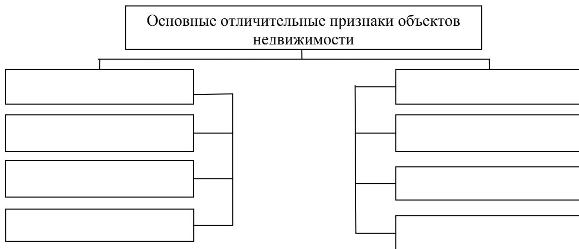
Рис. Основные отличительные признаки объектов недвижимости

27. Задание 2. Объясните, в каких случаях ценность всех объектов недвижимости на территории города может быть примерно одинаковой.