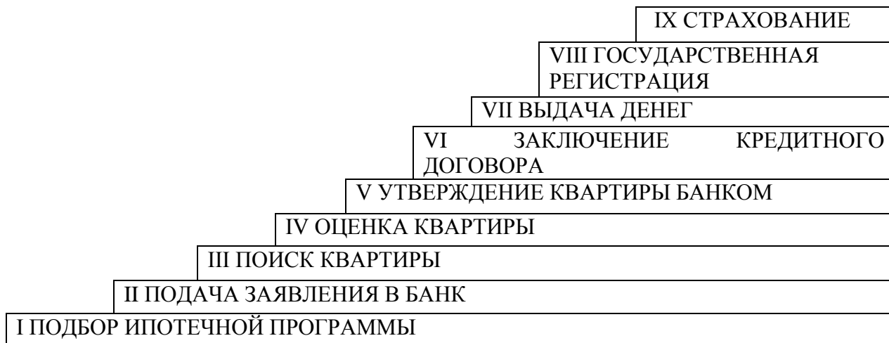
Рис. 2 Этапы приобретения квартиры с помощью ипотечного кредита

1. Домашнее задание 1. Основываясь на данных рисунка 2, письменно охарактеризуйте основные этапы приобретения квартиры с помощью ипотечного кредита.